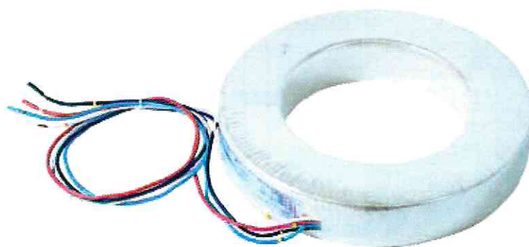
Рисунок 1 - Внешний вид трансформаторов ТВ-ЭК М1